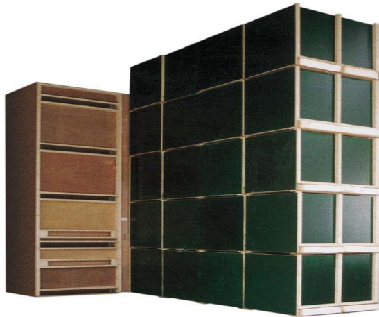
Voorbeeld opstelling drooginstallatie