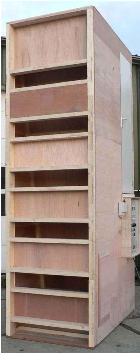
Drooginstallatie voor 1 - 6 kisten hoog gestapeld. Aantal kisten hoog naar wens.