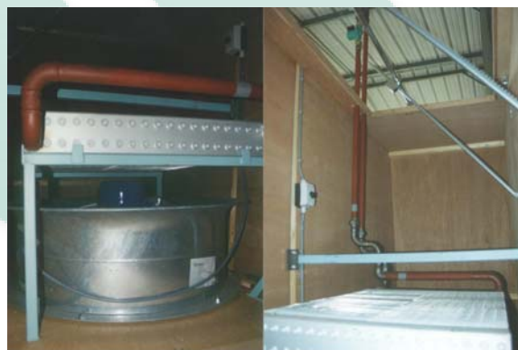
CV verwarmingsblok met regeling