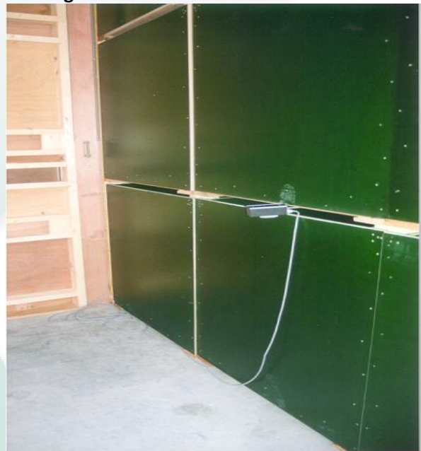
Lucht ontsnapt per laag langs de zijkant. Conditie uitgaande lucht (RV en T°) wordt gemeten.