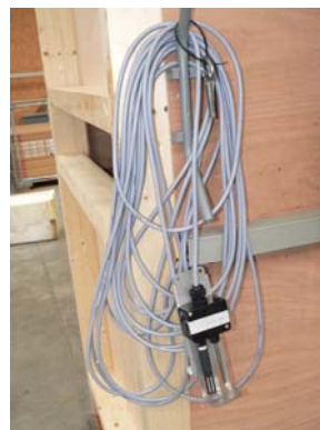
Product sensor voor meting lucht uit kisten.