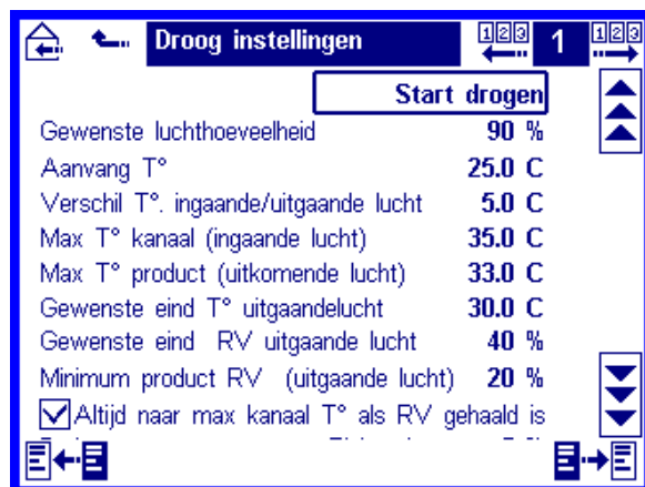
Instellingen drogen per sectie (Zie specifieke informatie)