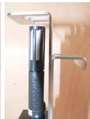
Beugel voor bevestiging aan zijkantkist