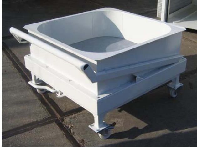
Droogkar met duwbeugel (ingeschoven)