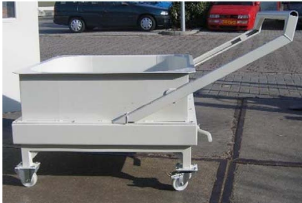
Droogkar met duwbeugel (uitgeschoven)